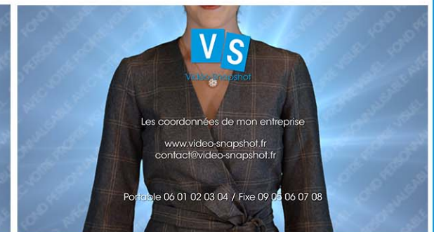
Plan 6 - vos coordonnées complètes 4 lignes maximum