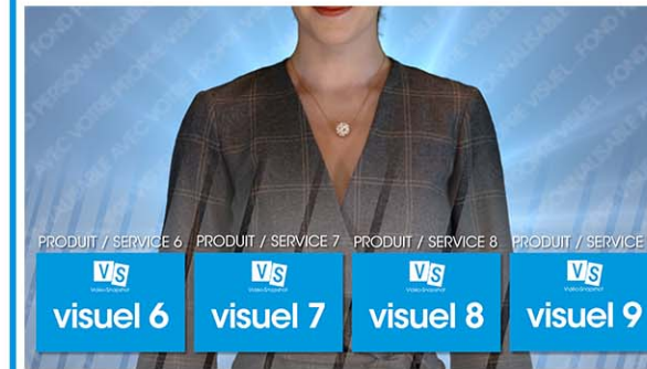
Plan 3 - vos produits ou services 4 textes de 20 caractères maximum*