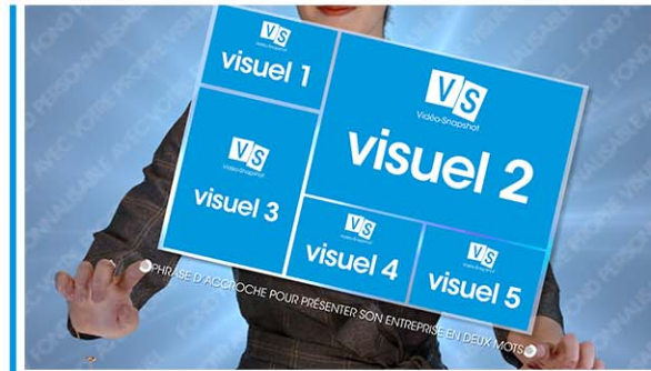
Plan 1 - présentation de votre activité une phrase de 60 caractères maximum*

les liens Youtube et Vimeo ainsi qu'un QR Code.