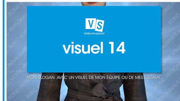
Plan 5 - votre slogan ou baseline Une accroche de 60 caractères maximum*