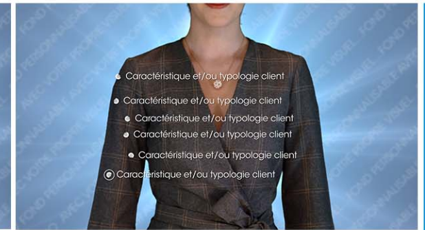
Plan 2 - vos cibles et/ou vos forces 6 textes de 40 caractères maximum*