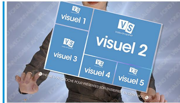
Plan 1 - présentation de votre activité une phrase de 68 caractères maximum*

les liens YouTube et Vimeo ainsi qu'un QR Code.