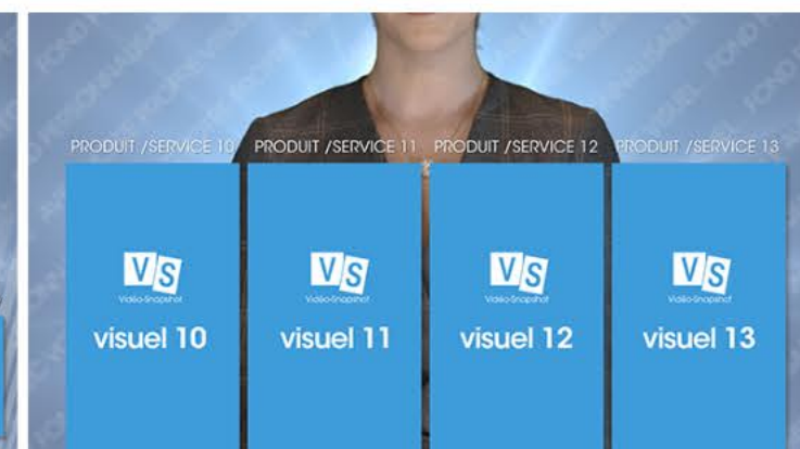
Plan 4 - vos produits - services ou typologie client 4 textes de 40 caractères maximum*