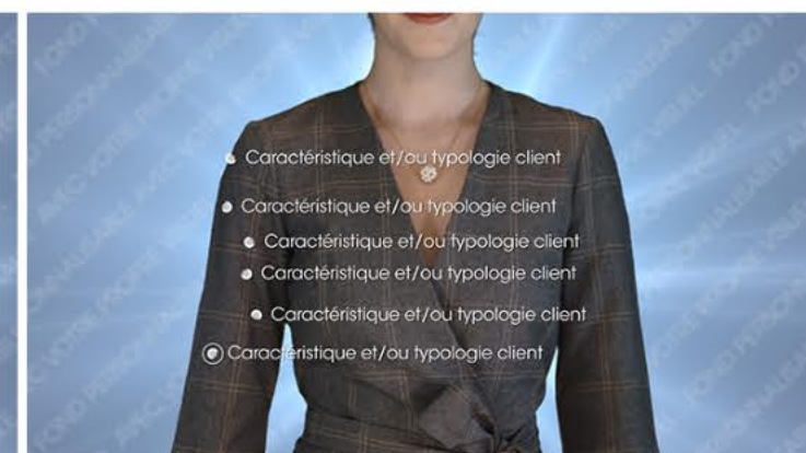
Plan 2 - vos cibles et/ou vos forces 6 textes de 40 caractères maximum*