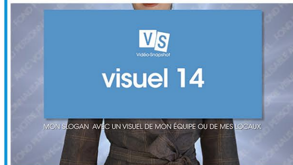
Plan 5 - votre slogan ou baseline Une accroche de 68 caractères maximum*