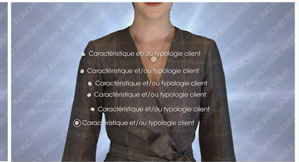
Plan 2 - vos cibles et/ou vos forces 6 textes de 50 caractères maximum*