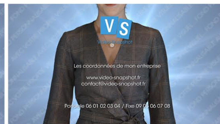
Plan 6 - vos coordonnées complètes 4 lignes maximum