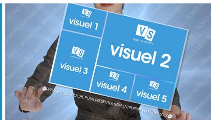
Plan 1 - présentation de votre activité une phrase de 60 caractères maximum*