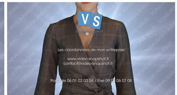
Plan 6 - vos coordonnées complètes 4 lignes maximum