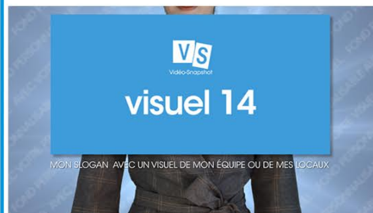
Plan 5 - votre slogan ou baseline Une accroche de 60 caractères maximum*